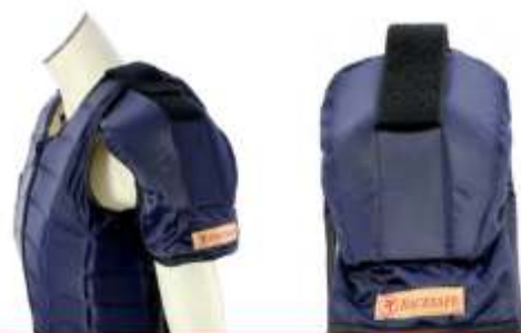
RS2000 SHOULDER PADS