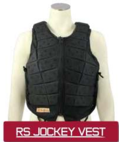
RS JOCKEY VEST